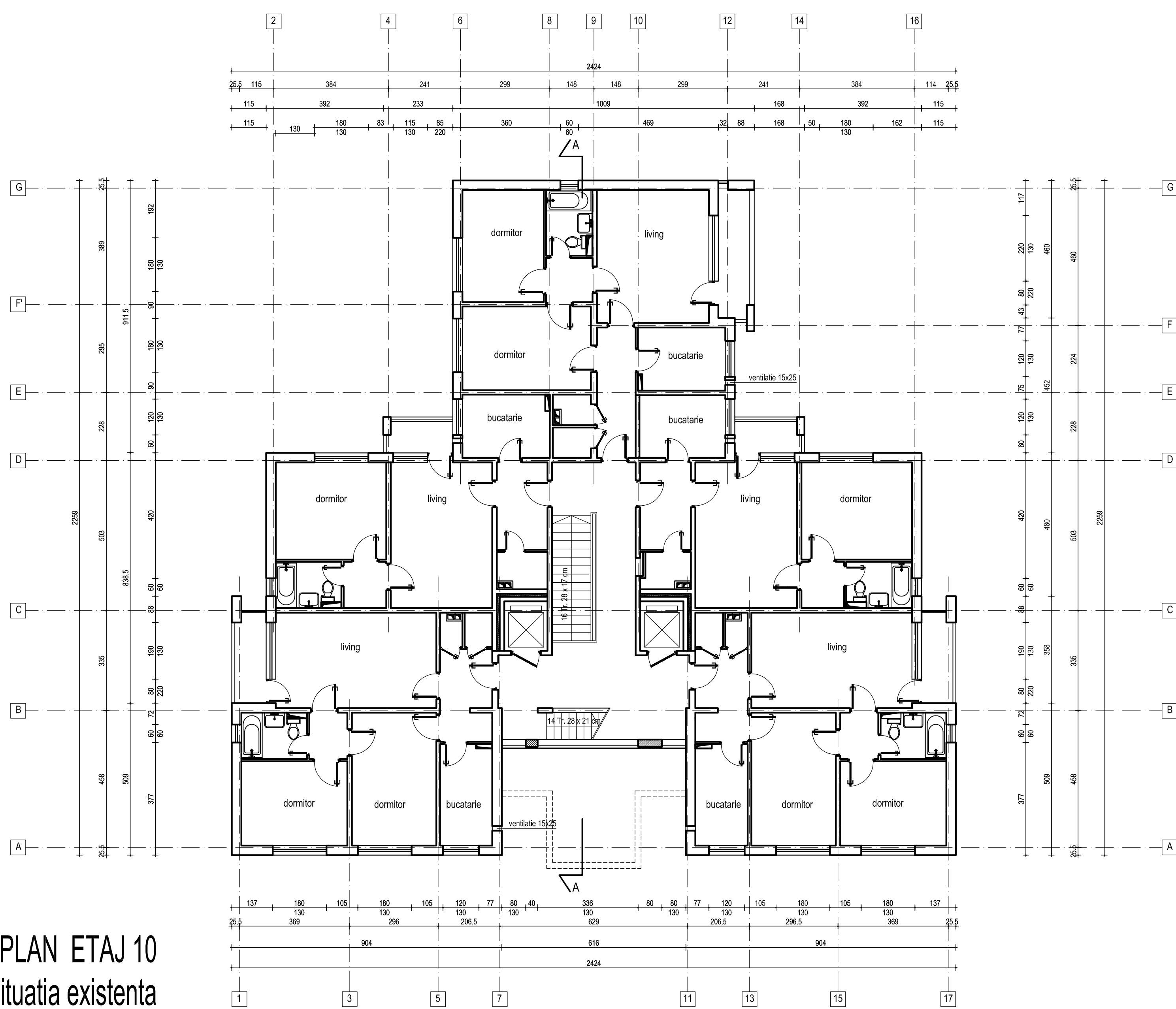
PLAN ETAJ 10 situatia existenta

CLASA DE IMPORTANTA A CONSTRUCTIEI III CATEGORIA "C" DE IMPORTANTA GRADUL II DE REZISTENTA LA FOC